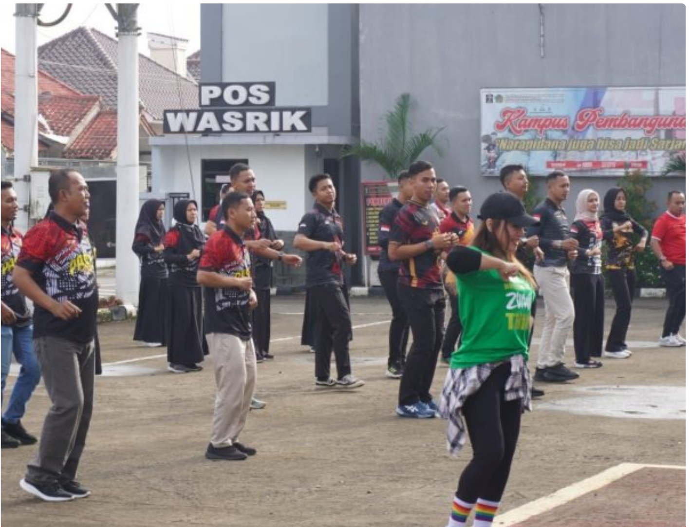
Jaga Kebugaran Tubuh, Pegawai Lapas Kelas IIA Purwokerto Senam Pagi Bersama

PURWOKERTO - Kegiatan senam pagi ini dilaksanakan di halaman gedung utama yang dimulai pukul 07.45 yang dipandu oleh instruktur profesional. Kegiatan ini diikuti oleh Kalapas dan seluruh pegawai Lapas Kelas IIA Purwokerto, pada Sabtu (25/1/2025).